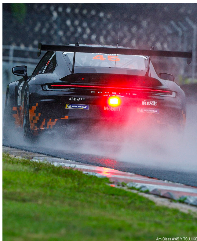
Am Class #45 Y. TSUJIKO

なお、第 4-5 戦の決勝レースはポルシェジャパン公式 Youtube チャンネル ( https://www.youtube.com/@PorscheJapanOfficial ) にてライブ配信を予定している。