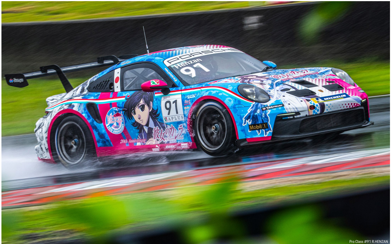
Pro Class #91 R.HENZAN

4月5～7日に鈴鹿サーキットで開催されたF1日本GPのサポートレースで、今シーズンの幕を開けたPCCJ。2001年から開催されているPCCJは、今年で開催24年目を迎えて国内におけるワンメイクレースとしてもっとも長い歴史を誇っている。導入3年目となる「911 GT3 カップ(タイプ 992)」のワンメイクレース専用車で競われ、今シーズンは6大会11戦が開催される。今回の第4-5戦は3大会目とシーズン中盤戦になるが、第2-3戦は5月2～4日に開催されているため約2カ月振りの大会となる。