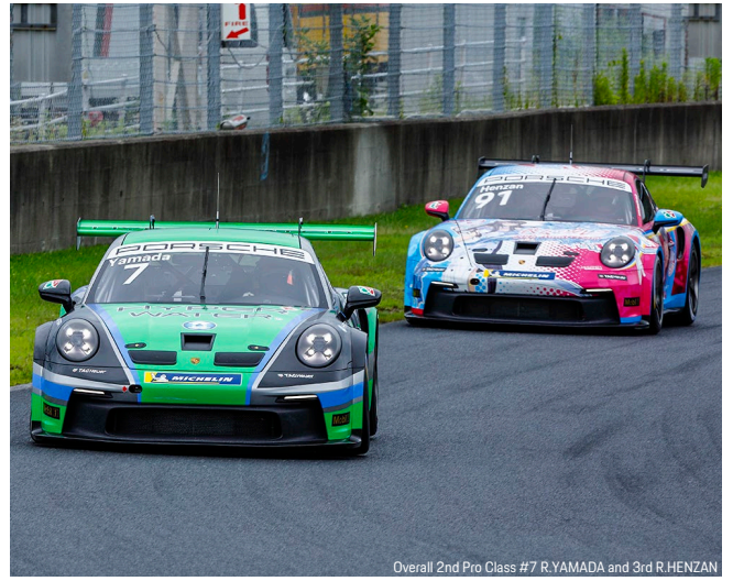
Overall 2nd Pro Class #7 R.YAMADA and 3rd R.HENZAN

PCCJ 第 6-7 戦は 7 月 20 日 (土)、21 日 (日) に、富士スピードウェイ (静岡県) で開催を予定する。次大会はスーパーフォーミュラの併催レースとして開催されるため、SUPER GT とは違った路面コンディションで、どのような戦いが展開されるのか注目される。