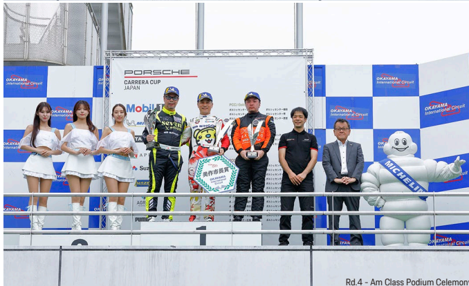
Rd.4 - Am Class Podium Ceremony