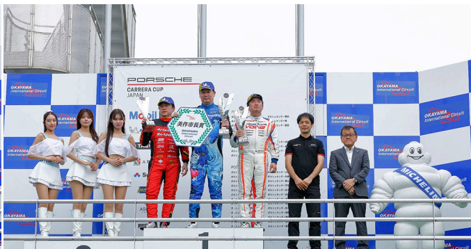
Rd.4 - ProAm Class Podium Ceremony