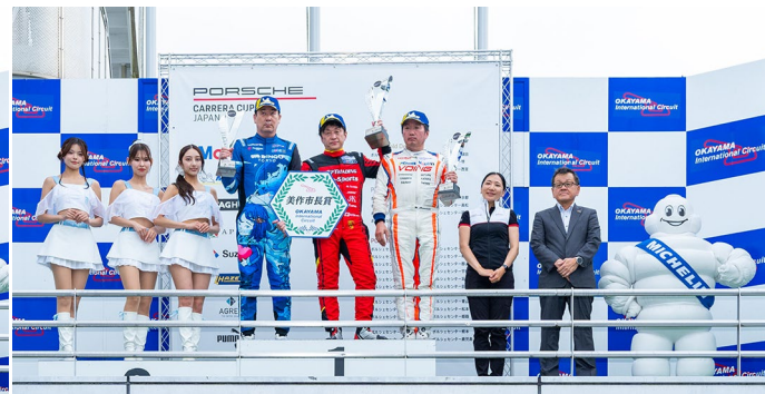
Rd.5 - ProAm Class Podium Ceremony