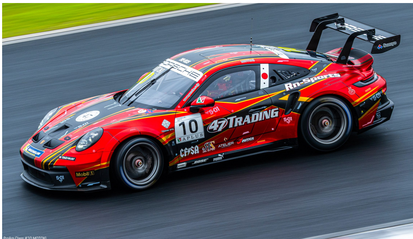
ProAm Class #10 MOTOKI