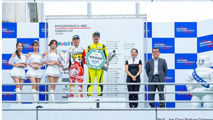
Rd.5 - Am Class Podium Ceremony