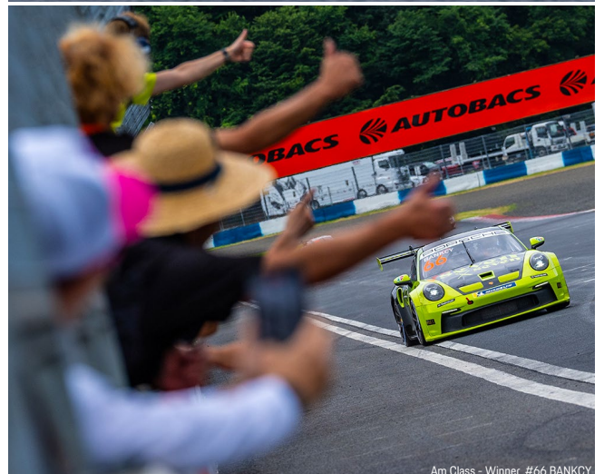
Am Class - Winner #66 BANKCY