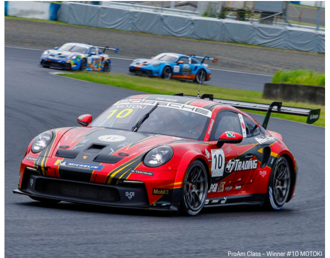
ProAm Class - Winner #10 MOTOKI