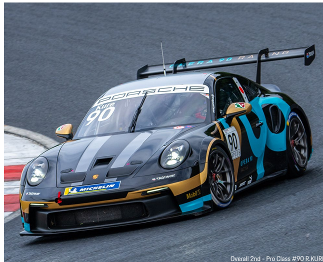
Overall 2nd - Pro Class #90 R.KURE

第 5 戦ライブ配信 URL (配信予定: 6 月 30 日 11 時 50 分~) https://youtu.be/2RDfIV9o3p8